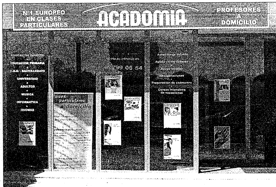
Academia está también presente en Alemania, Polonia, el Benelux, Portugal y, en breve, en Marruecos, donde negocia la concesión de su máster a empresarios locales.